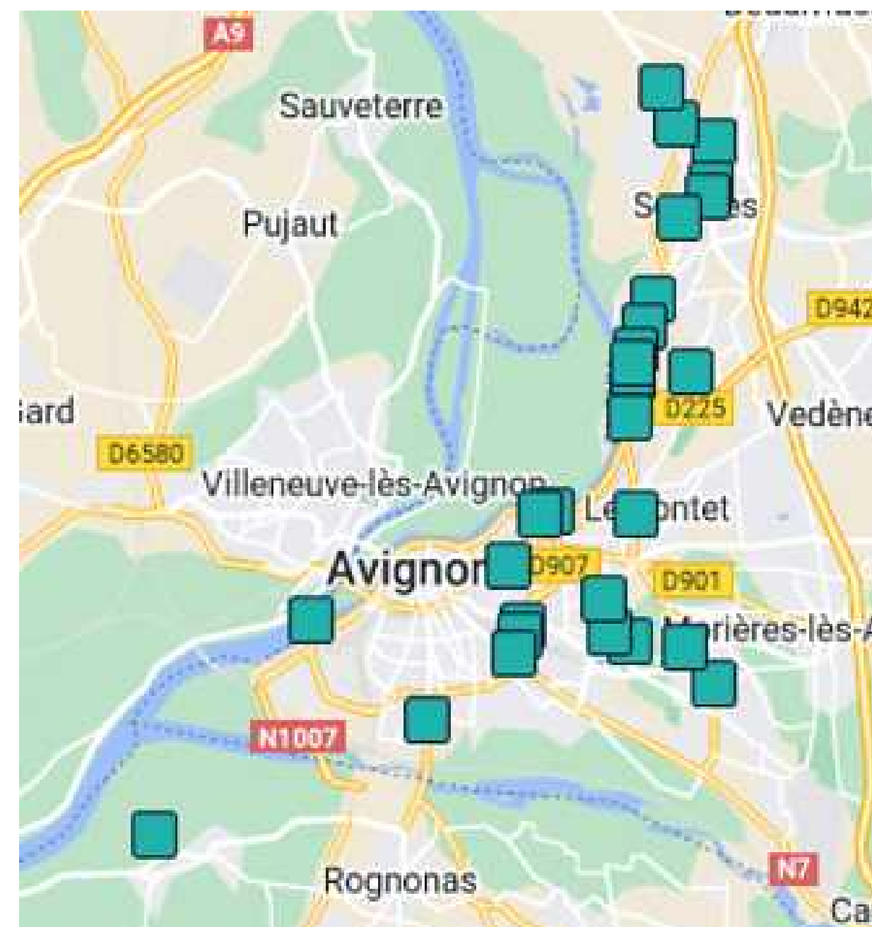
Photo non contractuelle